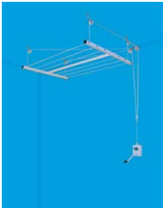
Tendedero el Sol