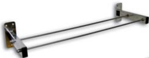
CÉSAR Modelo “ S ”. Longitud y Ancho Opcionales.

La calidad de los aceros inoxidable empleados para la fabricación de los tendederos de varillas fijas presenta una alta calificación y cumple las normas internacionales AISI 304 18/8, AENOR Z7CN18 - 09, BS 304S31 y SS 2332 - 02 . Los artículos de la gama César se pueden fabricar en diversas medidas: Longitud 75 - 100 - 120 - 140 cm. Anchura hasta 50 cm. Se debe tener precaución y evitar malas prácticas de limpieza que utilicen productos abrasivos que puedan afectar la superficie de uso.