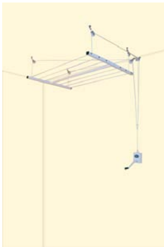
Tendedero el Sol